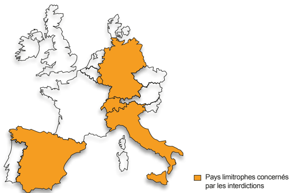
■ Pays limitrophes concernés par les interdictions